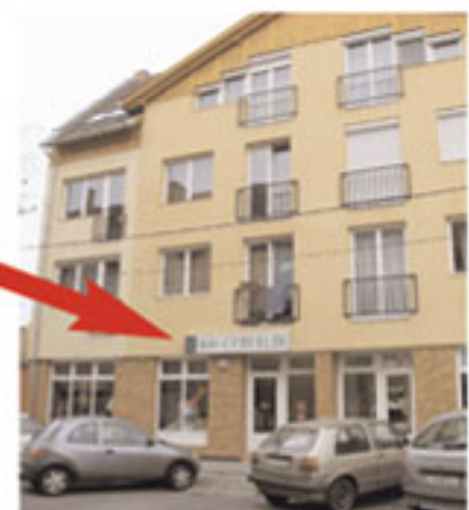
Biotextima szaküzlet Kecskemét, Kőhid u. 9.

A cég célkitűzése igen egyszerű: a 100 %-os vásárlói elégedettséget folyamatosan biztosítani.