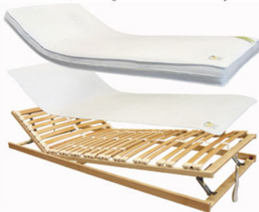
Vario-line lécesbetét: A derékrészen állítható keménység, az emelhető fej-és láb rész lehetővé teszi, hogy pihentethessük végtagjainkat, illetve olvasáskor se kelljen párnákkal "aládúcolni" a fejet.

lik, majd a folyamatos izomfeszülés fájdalomhoz vezet, a szervezet pedig automatikusan arra törekszik, hogy olyan testhelyzetet vegyen fel, amellyel a fájdalmat csökkenteni tudja. Ennek eredményeként kialakul egy olyan rossz tartás, amely a gerincoszlop deformitásához, és akár a csigolyák sérüléséhez vezethet.